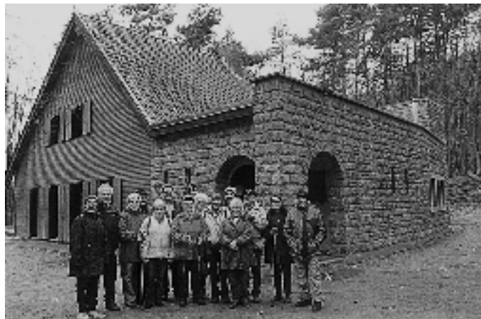
Gruppenbild der Wandergruppe des Evangelischen Kirchenchors Brühl und Rohrhof vor der Ramburgschenke

Am Samstag, 30.12.2006, trafen sich 21 Wanderfreunde am Parkplatz des Gemeindezentrums (GZ), um eine gemeinsame Wanderung zu unternehmen. Diese Wanderung war eine Premiere, denn sie war zum ersten Mal als Jahresabschlusswanderung vorgesehen.