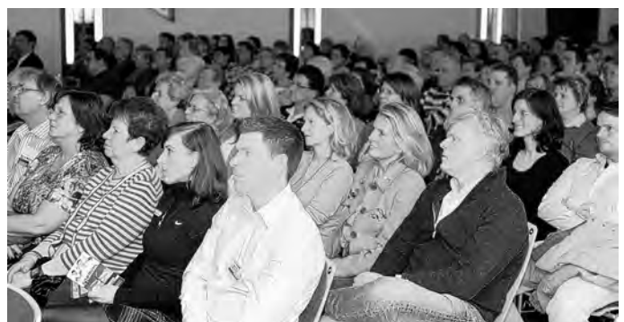
Fast 300 verfolgten interessiert und amüsiert den abwechslungsreichen Vortrag

Schließlich kann schon seit einigen Wochen eifrig auf der Internetseite www.bruehler-gesundheitsforum.de gesurft werden. Auch dort sind viele Informationen zu Gesundheitsdienstleistungen vor Ort gesammelt.